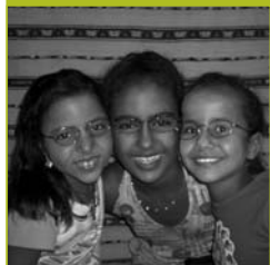
Proyecto NIÑOS SAHARAÍES