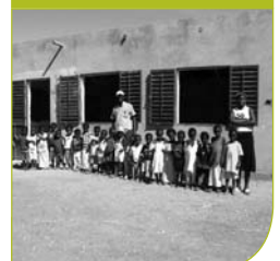
Centro de Salud SENEGAL