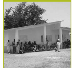
Casa Gaiato. MOZAMBIQUE